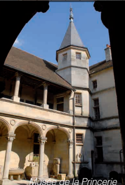
Musée de la Prinerie