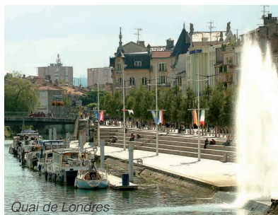
Quai de Londres

Réalisé sur pilotis à la fin du 19ème siècle, le mess des officiers (devenu hôtel-restaurant) fait partie des bâtiments nécessaires à la vie militaire. Il fut offert à la garnison par les entreprises en charge de la construction des forts, ouvrages et batteries aux alentours de Verdun.