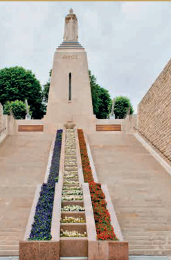
Monument à la Victoire

Ce circuit est consultable sur le site www.cirkwi.com et depuis votre smartphone ou votre tablette avec l'application Cirkwi.